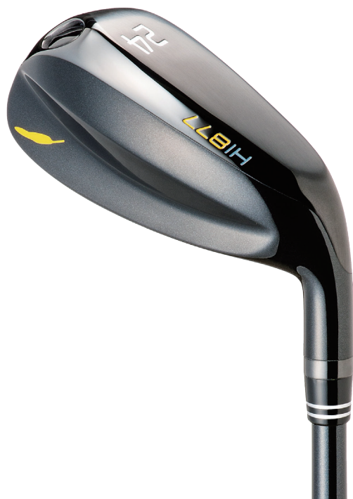
HI-877 BK version